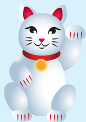
Chat en porcelaine